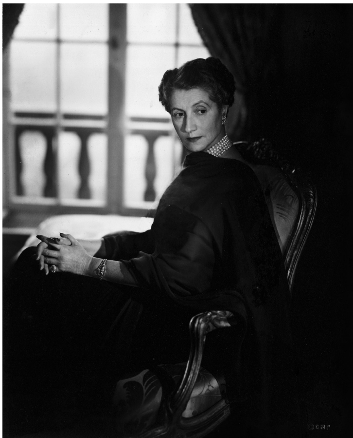
Die Baronin liess sich im Februar 1950 im Vogue Fotostudio in New York fotografieren.