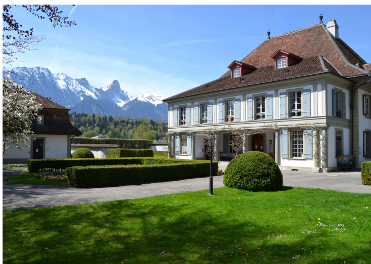
Die Ostfassade mit dem 1922/23 teilweise eingewandeten Peristyl. Die damals neu gesetzte Uförmige Buchshecke bezieht sich im Stil des Architekturgartens auf die Öffnungen der Säulenhalle.